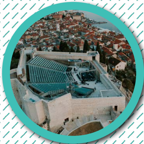
TVRĐAVA SVETOG MIHOVILA